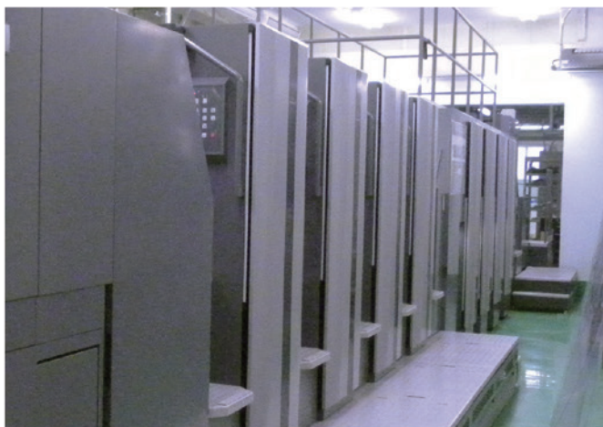
LED-UV乾燥システム付き菊全判4/4色タンデム式両面印刷機 DIAMOND V3000TP-8+LED-UV

基本コンセプトは「人を大切に。従業員を大切に。そしてお客様を大切に。それはGoodではなくBetterでもない。常にBestを尽くす」。2011年から価格競争ではなく、「クオ